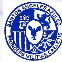
Secretario General Técnico