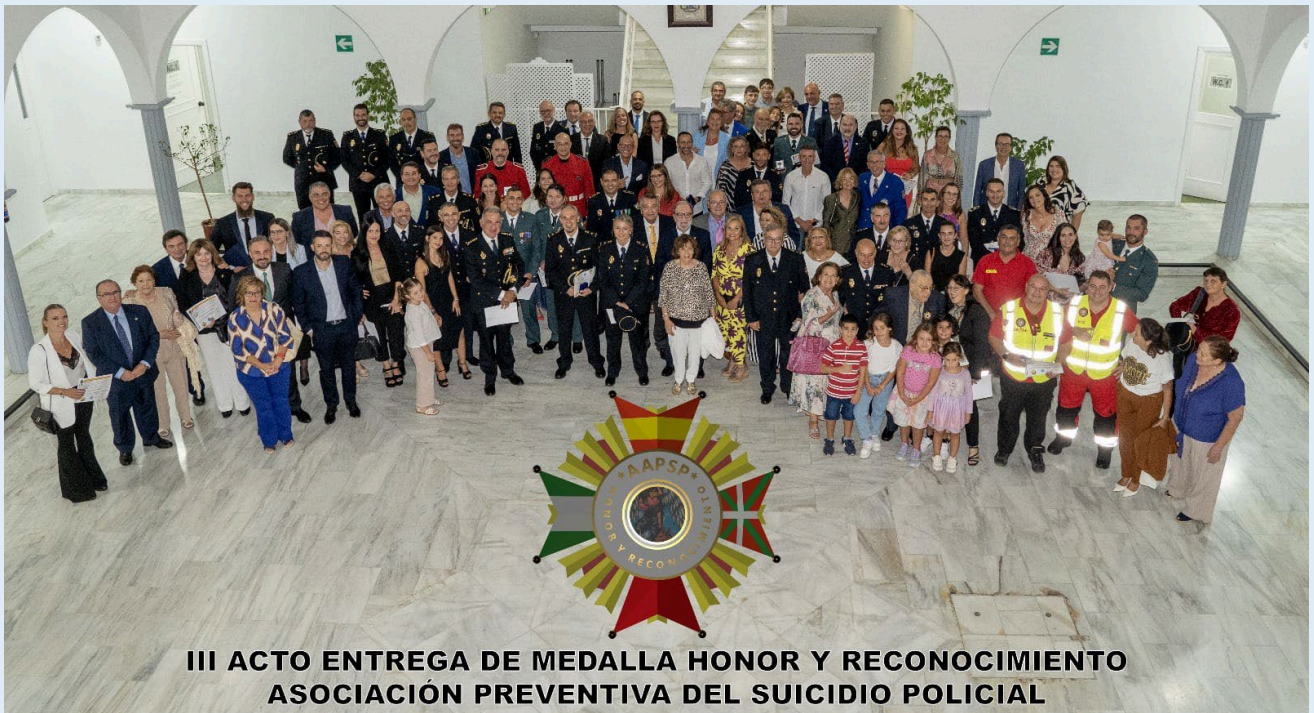
III ACTO ENTREGA DE MEDALLA HONOR Y RECONOCIMIENTO ASOCIACIÓN PREVENTIVA DEL SUICIDIO POLICIAL